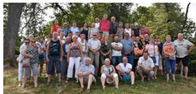
Jumelage Hamois – Valgorge