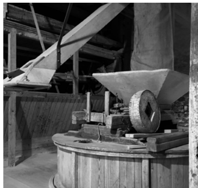
Journée du Patrimoine au Moulin de Hamois