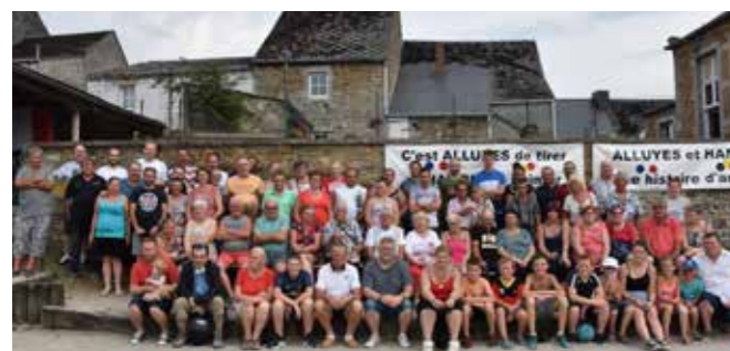
Jumelage Hamois – Alluyes

Disponible dans votre office du tourisme: La nouvelle carte « Sentier d'art » qui reprend le sentier dans son entièreté! 3€.