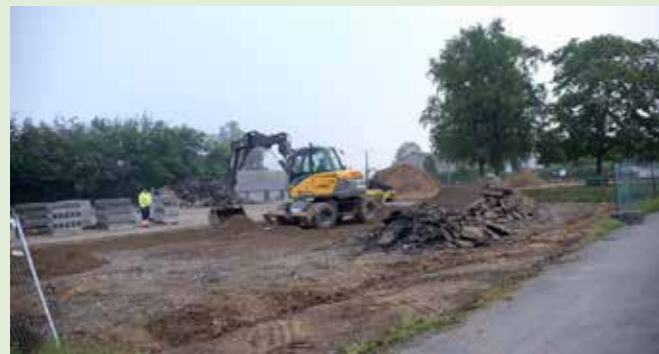
Début des travaux de la plaine Eugénie à Mohiville