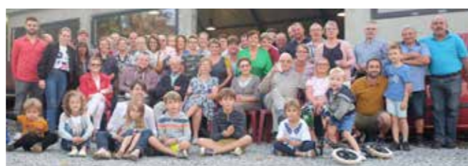
Barbecue de quartier – Rue de Flostoy à Schaltin