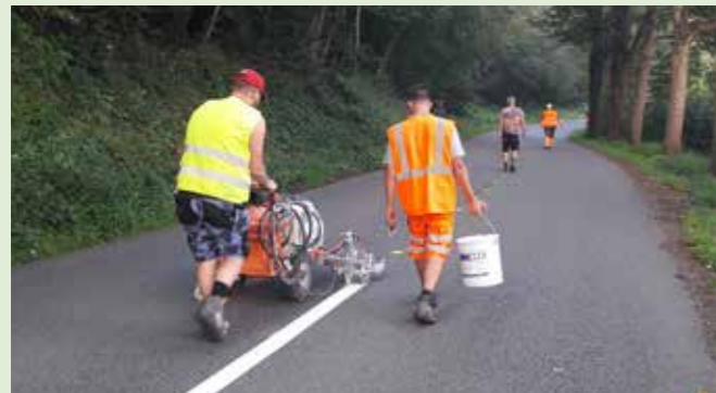
Marquage au sol