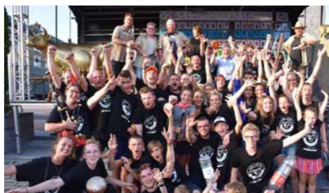
Jeux de la vache à Ciney – Victoire de Hamois