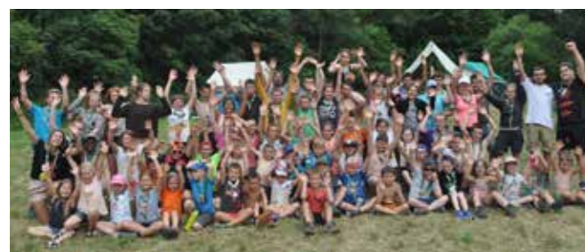
Les patronnés de Hamois à Bomal