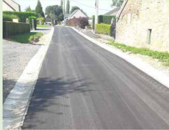
Rénovation de la rue Wachenne à Schaltin via le plan d'investissement communal