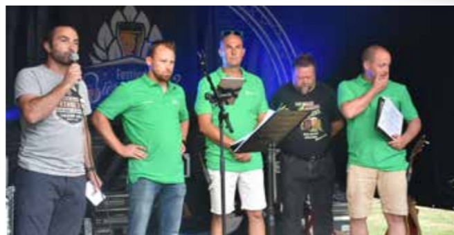
Festival 2019 Bièrez-vous à Schaltin